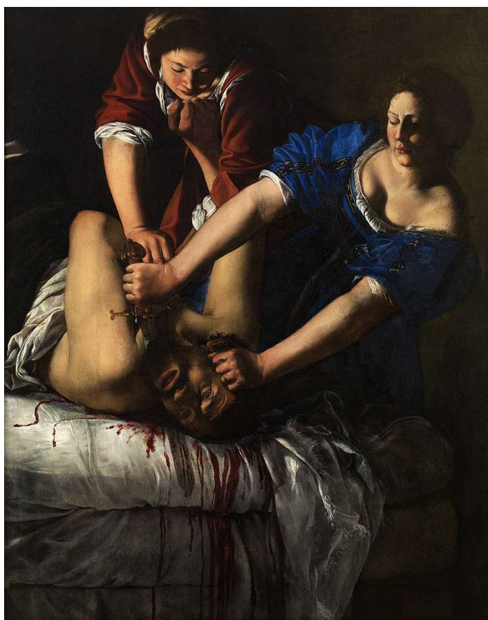
Giuditta che decapita Oloferne , 1612-1613 Museo Nazionale di Capodimonte, Napoli