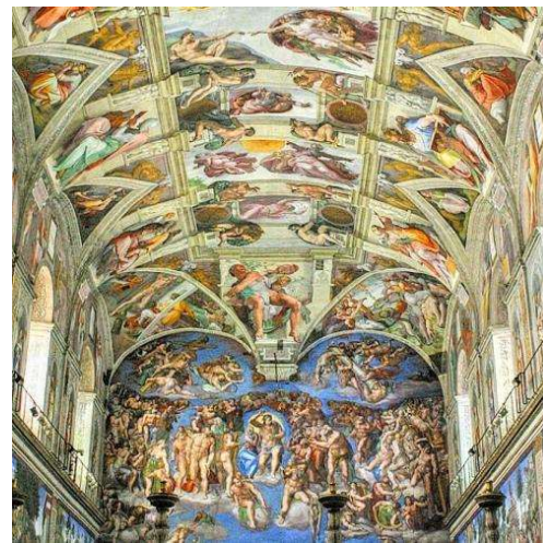
Giudizio universale , 1536-1541 affresco, cm 1370-1200 Vaticano, Cappella Sistina