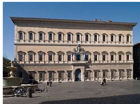
Facciata di Palazzo Farnese 1547-1550, Roma