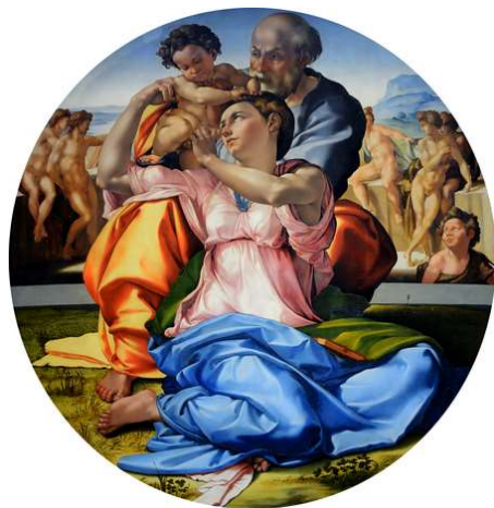
Tondo Doni , 1506 Tempera grassa su tavola, cm 120x120 Firenze, Uffizi