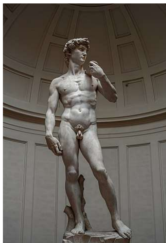
David , 1501-1504 marmo, cm 517x199 Firenze, Galleria dell'Accademia