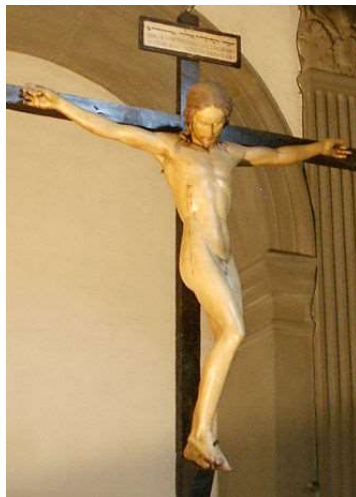
Crocifisso di S. Spirito , 1493 scultura lignea, cm 139x135 Firenze, Santo Spirito